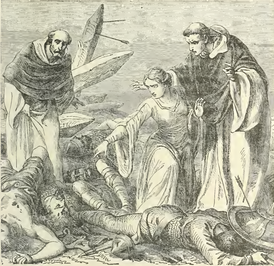
Après la bataille de Hastings.

Pendant que ce grand armement se préparait en Normandie, Harold, roi de Norvège, fidèle à ses engagements envers le saxon